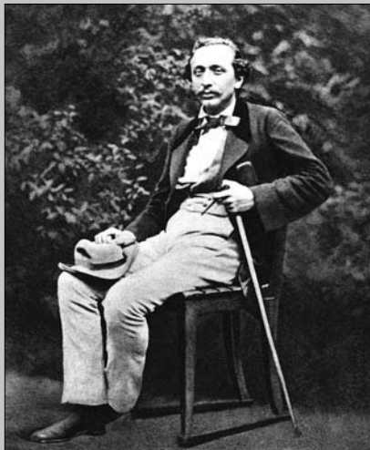
Mladý Jan Neruda