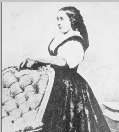
Johana Mužáková alias Karolína Světlá v roce 1962

Johana brzy po svatbě otěhotněla. Manželé žili v domě u Valšů v dnešní Betlémské ulici. Jejich vztah byl harmonický. Když Petr prodléval mimo domov, psal ženě láskyplné dopisy, nazýval ji svým blahým draboušem a nabádal ji, aby se šetrila a pečovala o své zdraví. Dopisy končily slovy: „ Tvůj Tě vřele milující manžel Mužák. “ V podobném duchu odpovídala i Johana: „ Blaho mé jediné, ty můj rozkošný drabouši! “ Johana nikdy muži neříkala křestním jménem, hovořila o něm jako o Mužákoví, častěji jako